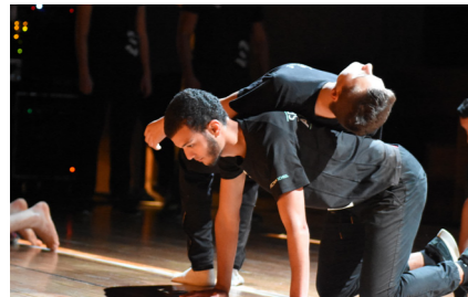
Spectrumschool op de Cultuurdagen voor leerkrachten in opleiding

De werking van Passerelle is divers. In onderstaand overzicht tonen we aan de hand van enkele projecten en ontmoetingen hoe breed de werking van Passerelle doorheen een jaar wel is.