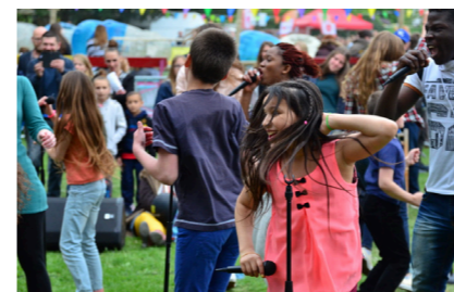
We Can Be Heroes met Groupenfonction