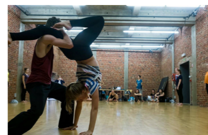
Danspunt Invites@Kortrijk